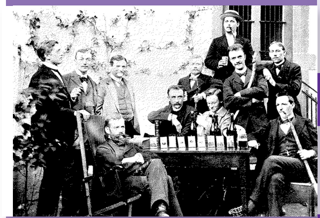
Vikariatskurs von 1897

Frauen können in Hessen erstmals das theologische Universitäts-examen ablegen.