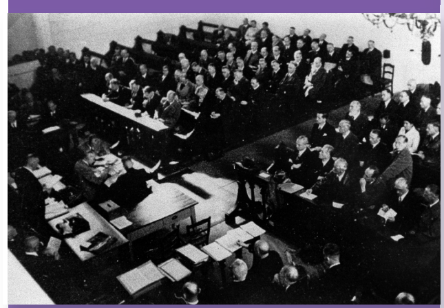
Gründung der EKHN

Frauen und Männer gestalten Kirche – trotzdem werden bis ins 20. Jahrhundert auch in den Kirchen der Reformation nur Männer in geistliche Ämter ordiniert.